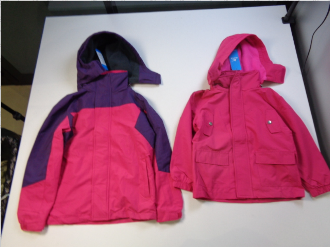
玫红外套；玫红拼紫外套